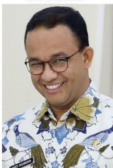
ANIES BASWEDAN Gubernur DKI Jakarta